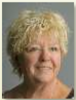
Regie und Produktionsleitung: Ruth Grossenbacher

Gelingt nun wirklich die Überführung mit Hilfe eines versteckten Mikrofons?